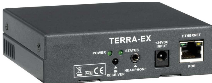
PPMS TERRA EX