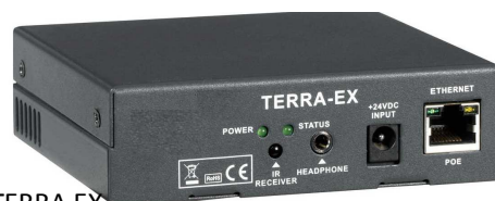
PPMS TERRA EX