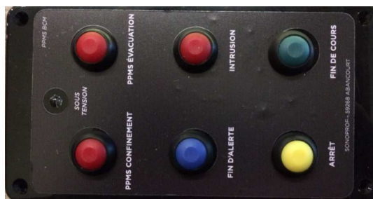
Réf. PPMS BCM